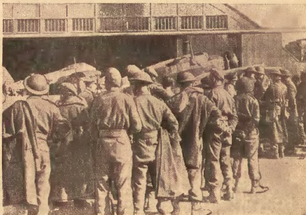
Na lewo: Miasto i port Tunis, widziany z lotu ptaka. — Na prawo: Angielcy jeńcy czekają na lotnisku niemieckim w Tunisie na przesłuchanie.