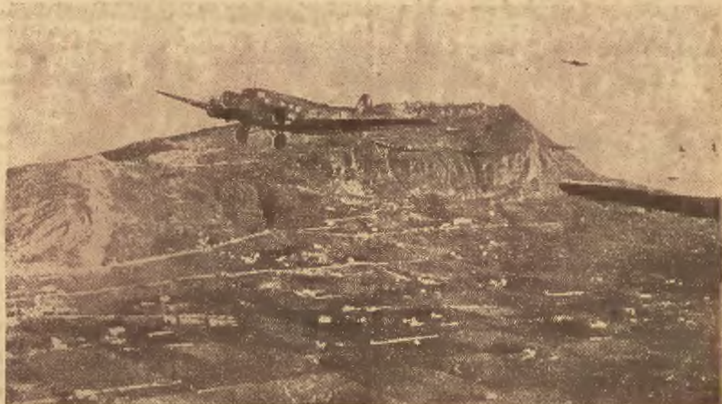
Na lewo: Walki na wschodzie prowadzone są przy użyciu najbardziej nowoczesnych urządzeń. Na naszym zdjęciu widzimy jak oddział żołnierzy, który natrafił na większe siły nieprzyjacielskie, zwraca się przy pomocy radia o posiłki artyleryjskie do swojej komendy. — Na prawo: Olbrzymie samoloty Junkersa używane są na froncie afrykańskim jako transportowce przewożące materiał bojowy. Oto jeden ze samolotów szybujący nad miastem afrykańskim.