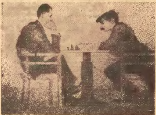
Powyżej karykaturowanie Laskera i Janowskiego. Kary- katurzysta świetnie uchwycił charakterystyczną po- zycję obu graczy przy graniu w turnieju o mistrzo- stwo świata w 1910 roku.

Podobne przykłady można by dowolnie mnożyć. Do- wodzą one, że szachści są przeważnie oryginalnymi, stanowiącymi wdzięczny temat dla karykaty.