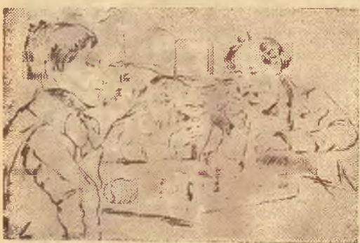
Karykatura mistrza Keresitzkiego, zrobiona w ub. stuleciu w „Cafe de la Regence“ w Paryżu.