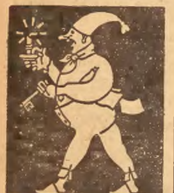
FOTO-KINO ST. MALECZEK Warszawa, ul. Senatorska 17, poleca tanie aparaty fotograficzne i kinowe, oraz wszelkie przybory. Patentowane przystawki filmowe do aparatów kliszowych. Wysyłka na prowincję za zaliczeniem.

KSIAŻKI kupujemy płaćmy dobre ceny. ANTYKWARJAT S. ADAM Kraków, ul. Szpitalna 16.