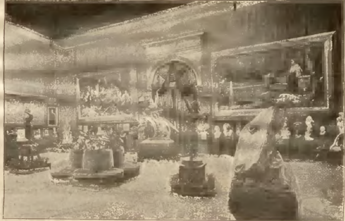
Wnętrze salonu I.