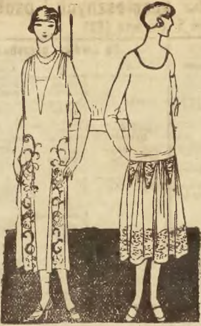
Ostatnie modele paryskie.