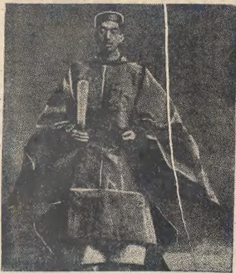
Cesarz Japonji w stroju narodowym.

W całej Japonji odbywają się w dniu 11 lutego wielkie uroczystości w związku z największym świętem japońskim, jakim jest rocznica wstąpienia na tron antenata domu cesarskiego cesarza Dżimmu. Jak wiadomo, historia rodziny cesarskiej najściślej złączona jest z historją Japonji i jej religją. Legendarny przodek obecnego cesarza miał żyć w r. 660 przed erą chrześcijańską, a jego 124 z kolei następcą jest obecny cesarz Hirohito. Dom cesarski Japonji uchodzi ogólnie za najstarszą dynastję, jest to jednak omyłka, gdyż genealogja tej rodziny została kilkakrotnie przerwana przez wygaśnięcie tej rodziny. Istnieje natomiast w Japonji