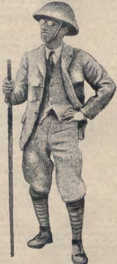
Hirohito w stroju turystycznym.

panuje ona od 300 zaledwie lat, pochodzi z Mandżurji. W roku 1637, a więc dokładnie trzystatrzynaście lat temu zawiązała ona dzisiejsze Chiny, zdetronizowała dynastję Ming i zawiązała krajem. Obecny cesarz Mandżurji Pu-Yi, panujący w Mandżukuo utracił tron chiński w 1912.