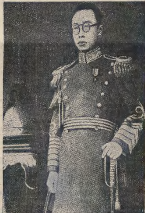
Kang-Teh-Pui, cesarz Mandżurji.