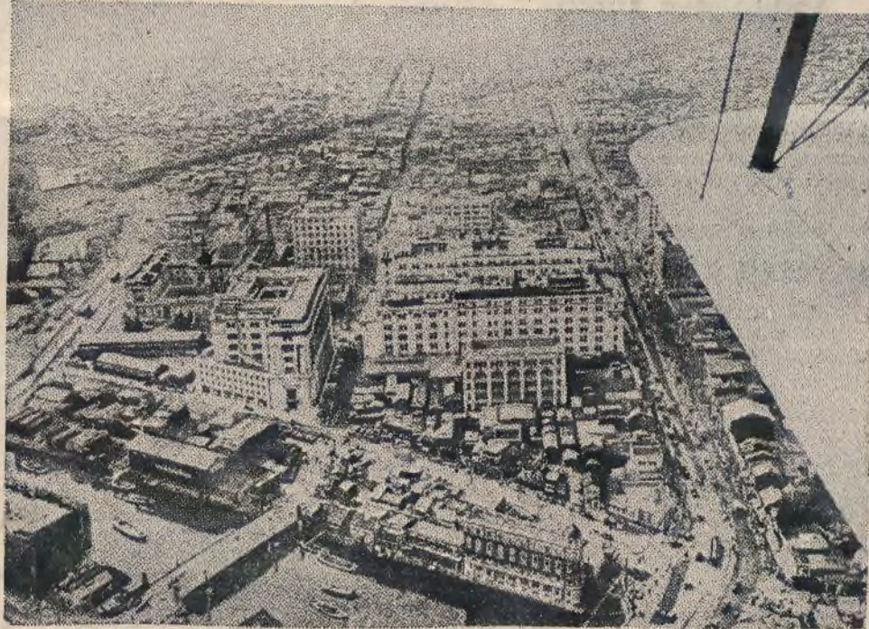
Fragment stolicy Japonji z lotu ptaka.