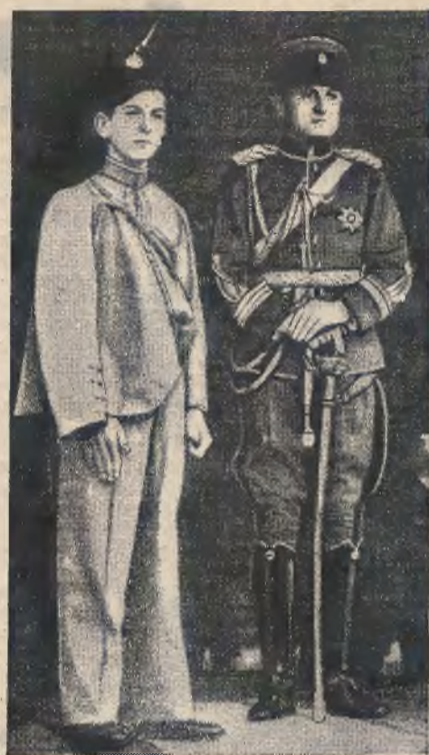
Ke, regent Pawel.

zanim zostali królami pruskimi w r. 1701, a następnie cesarzami zjednoczonych Niemiec w r. 1870, byli margrabiami brandenburskimi, panując obecnie tylko w Rumunji, od r. 1866. Dynastja ta należy również do starożytnych, pierwszym znanym protoplastą jest Burchard de Zolerin w r. 1061, a zamek ich rodzinny leży w Szwabji. Poza Prusami panowały katolickie linje tej rodziny na dwóch małych księstwach, tj. Hohenzollern-Hechingen i Hohenzollern-Sigmaringen. Inne panujące dawne domy niemieckie jak Wittelsbachowie (Bawaria), Zähringenowie (Baden), Württembergowie, Waldeckowie itd. pochodzą z X do XII wieku.