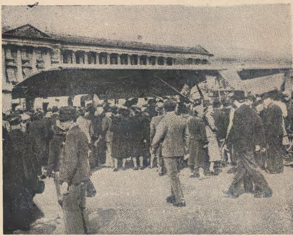
Wojska niemieckie zajęły stolicę Francji. Powyżej zamieszczamy dwa zdjęcia dotyczące tego historycznego wydarzenia. Na lewo: niemiecki generał dywizji przyjmuje defiladę swego oddziału na Placu Zgody. Na prawo: chwila wylądowania jednego z samolotów niemieckich typu „Fieseler” na Placu Zgody w Paryżu. — Publiczność paryska tłumnie ogląda pierwszy samolot niemiecki widziany zbliżka.