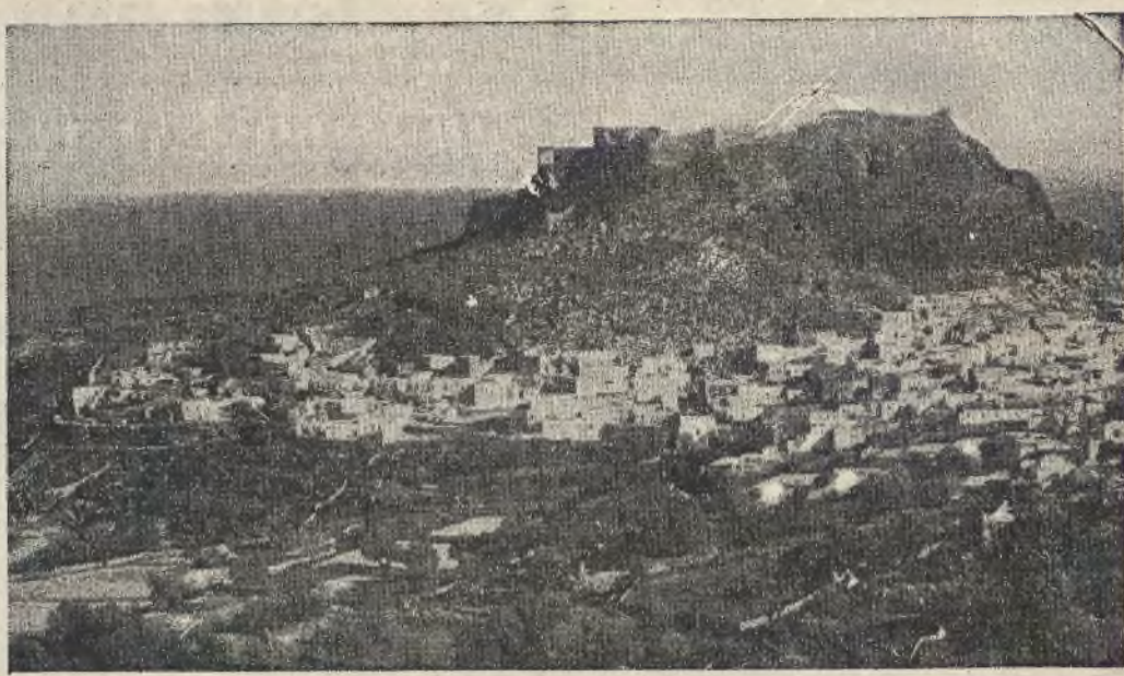
Blok gmachów zakonu Joannitów na wyspie Rodos.