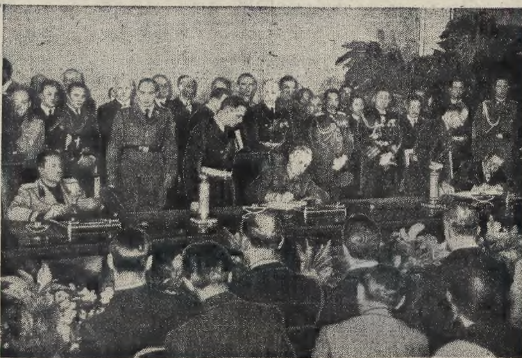
W dniu 27 września minister spraw zagranicznych Rzeszy von Ribbentrop, minister spraw zagranicznych Włoch hr. Ciano i ambasador japoński w Berlinie Kurusu podpisali Pakt Trzech Mocarstw, między Niemcami, Włochami i Japonią. Zdjęcie nasze przedstawia moment podpisania paktu w wielkiej sali nowego urzędu kanclerskiego Rzeszy w Berlinie.