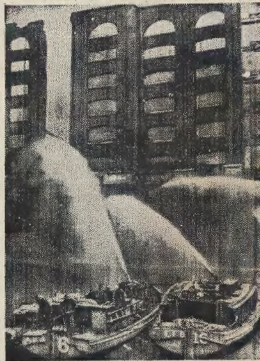
Szkody, wyrządzone przez bombardowanie Londynu podczas nalołów niemieckich bombowców, są olbrzymie. Zdjęcie nasze pokazuje fragment gaszenia pożaru w domu składowym na wybrzeżu Tamizy przez straż pożarną ze statków pożarniczych.