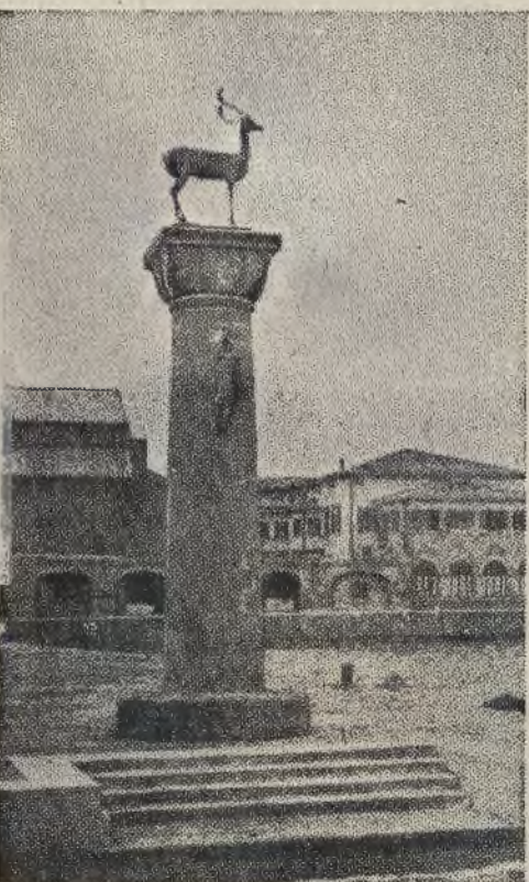
Znany pomnik na Rodos.

Madryt, 4 października. Co zrobić z kawą? — oto zagadnienie, nad którym zastanawiają się eksporterzy krajów południowo-amerykańskich, a zwłaszcza Brazyliji. Jak wiadomo zostały tam zgromadzone olbrzymie zapasy kawy, których nie można obecnie eksportować, z powodu toczącej się na kontynencie europejskim wojny. Obrabujący eksporterzy zdecydowali się prawdopodobnie użyć kawy jako środka opałowego, a kto wie, czy część zapasów nie pójdzie — jak omgias — na dno morza.