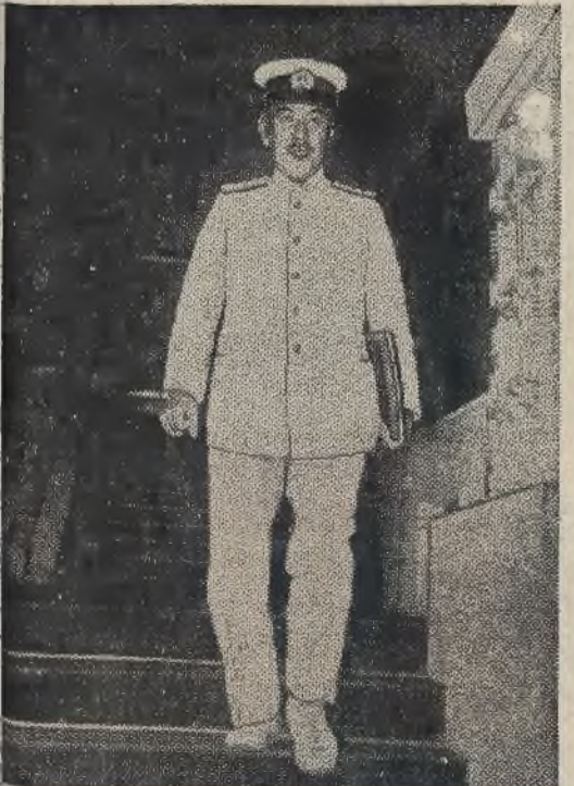
Jednym z najbardziej wpływowych ludzi w nowym gabinecie japońskim jest minister marynarki Koshiro Oikawa, którego przedstawia nasze zdjęcie.

ciągami za miasto do jednej z grot, wykopanych w czasach przedhistorycznych przez przodków Brytyjczyków. W jaskiniach tych wilgoć ścieka ze ścian i sufitu. Groty te stały bezużyteczne przez szereg stuleci, aż dopiero teraz zaczęto je znowu używać. Szereg firm autobusowych organizuje każdego wieczora „wycieczki” do tych grot, przy czym za dwa szylingi i 6 pensów otrzymuje się miejsce siedzące.