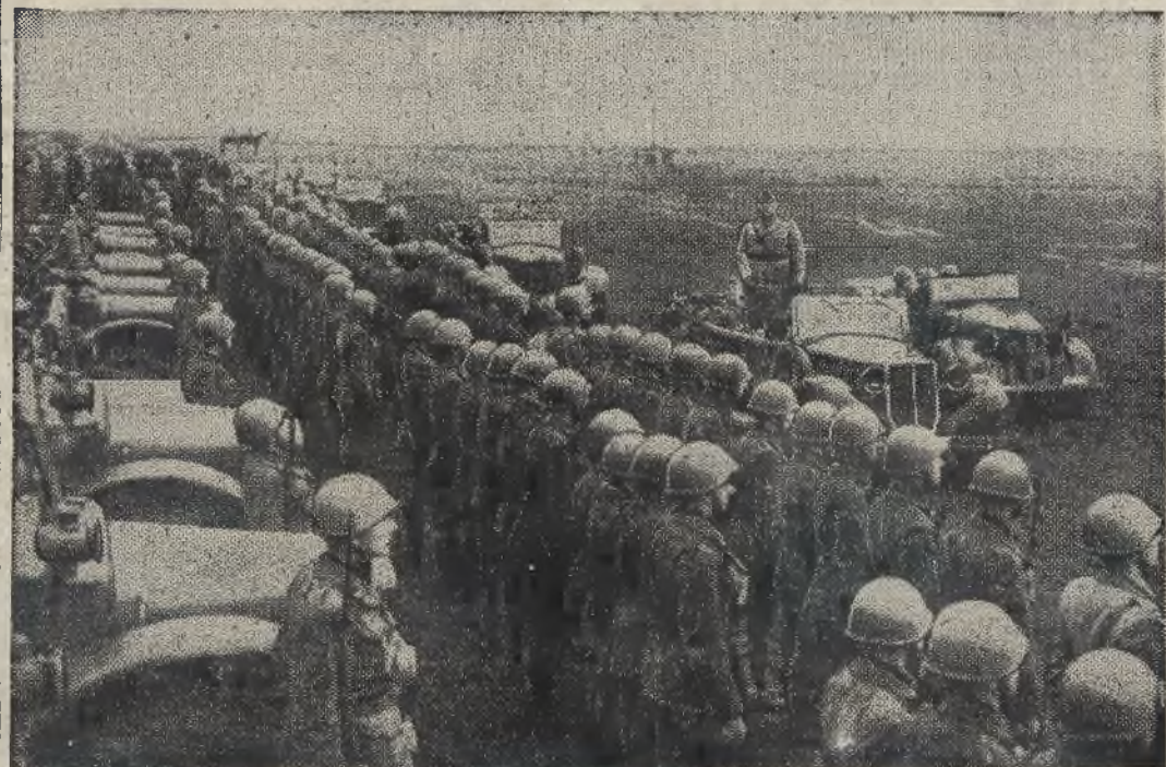
W ramach wizytacji armji nadpadańskiej Mussolini dokonał również przeglądu jednostek wojskowych, stacjonowanych w Spilimbergo pod Udine. Zdjęcie nasze przedstawia Mussoliniego podczas przejazdu przed frontem oddziałów wojskowych w Spilimbergo pod Udine.

Mussolini na przeglądzie armji nadpadańskiej.