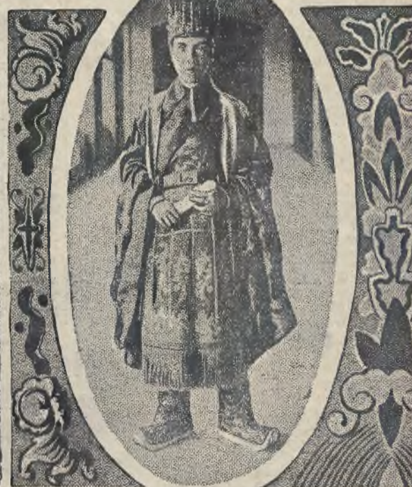
U góry: Trzech mandarynów anamskich. Wejście do palacu cesarskiego w Anamie. U dołu: Chata tubylercy w Kambodży. Cesarz Anamu.