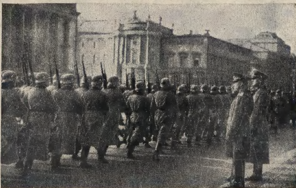
Podczas pobytu w Berlinie szef państwa rumuńskiego gen. Antonescu złożył wieniec na grobie nieznanego żołnierza. Na zdjęciu widzimy defiladę oddziału honorowego przed gen. Antonescu na „Unter den Linden” w Berlinie.