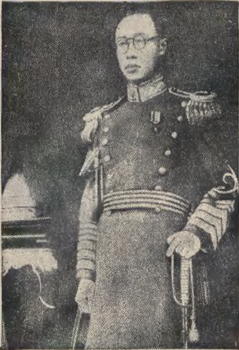
Cesarz Mandżurji Kung-Tok (Pu-Ji).