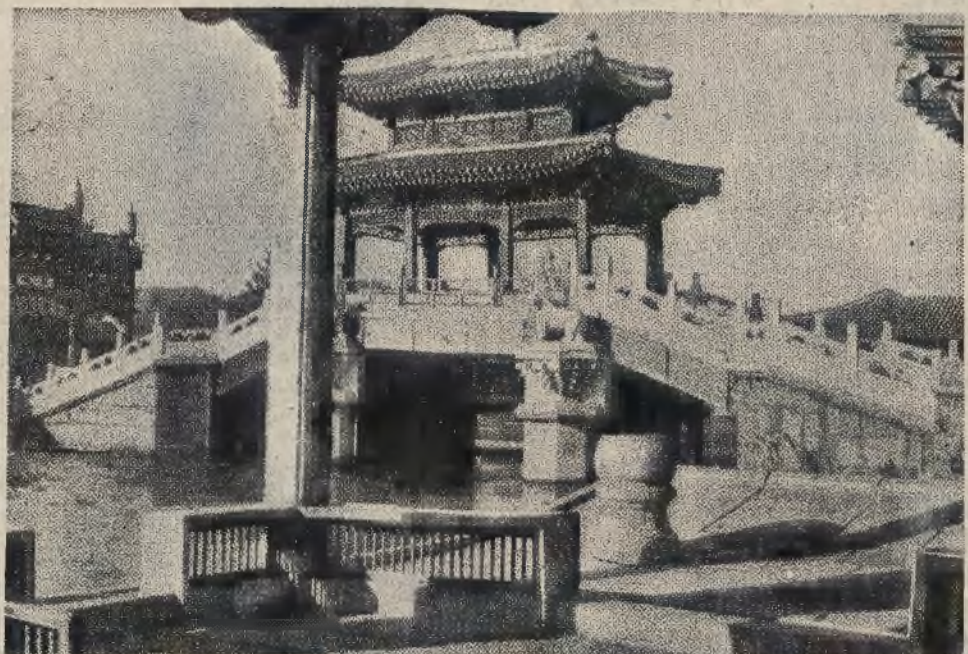
Most mahoniowy w parku cesarskim w Pekinie.

Gdy ekspres syberyjski opuszcza terytorjum Sowietów, zatrzymuje się na granicznej stacji Mandżuli, która jest ubogą miejscina, a właściwie osada, nie posiadająca nic, prócz dworca. Ale po pewnym czasie dojeżdża pociąg