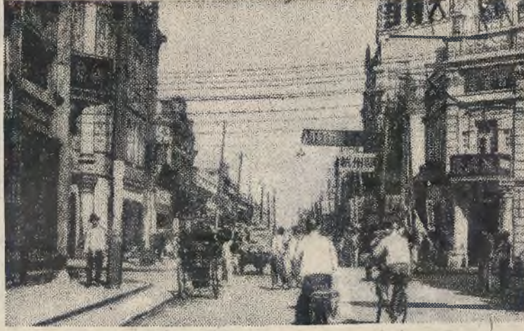
Na lewo: świątynia Konfucjusza w Charbinie. Na prawo: Główna ulica w Mukdenie.