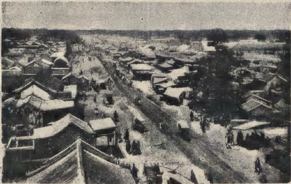
Widok ogólny Pekinu.

szta żaden wpływ i żadna imigracja nie dziwi Chińczyków ; są oni do tego przyzwyczajeni od tysięcy lat. Przychodzili tutaj Mongołowie, Mandżurowie, Malajowie, a nawet Arabowie i żydzi i jakoś wszyscy stracili swoje cechy narodowe i wsiąkli w ołbrzymim morzu chińskim. Rasa żółta, a zwłaszcza Chińczycy, posiadają ten jakiś dziwny żółty urok „the yellow charme”, jak nazywają to Anglicy i dlatego też trudno jest utrzymać się w chińskim morzu innym narodom swoją odrębność.