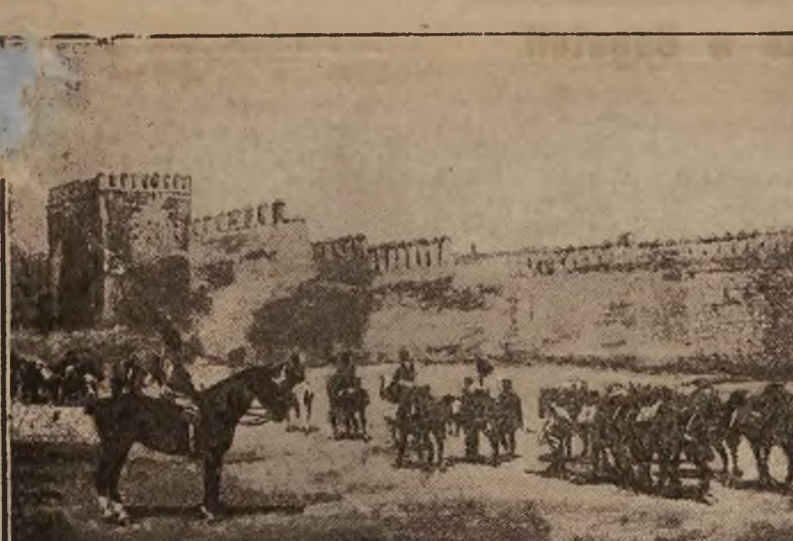
Wojska francuskie w pochodzie ku pozycjom.

Mam jednak nadzieję — kończył swoje informacje p. prezes komisji teatralnej — że wypadek tak smutny, niestety, wpłynie na opamiętanie się tych radnych miejskich, którzy swą zbyt pochopnie powziętą uchwałą do pewnego stopnia reprezentację miasta