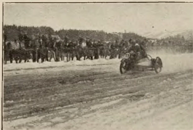
Wyścigi motocyklowe w Zakopanem.

da prawo obywatelstwa w Zakopanem i... dlatego jest w Zakopanem sezon.