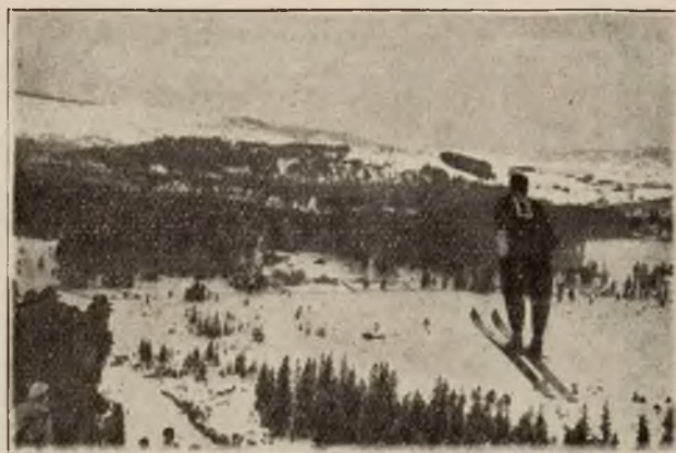
Skoki na Krokwi w Zakopanem.