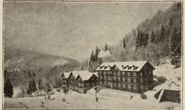
„Karolówka“ i „Żegotka“ w Żegiestowie.

Ryczałtowe sezony wiosenny i jesienny. Ryczałtowa opłata w sezonie wiosennym od 1/III. do 31/V. wynosi za 3-tygodn.