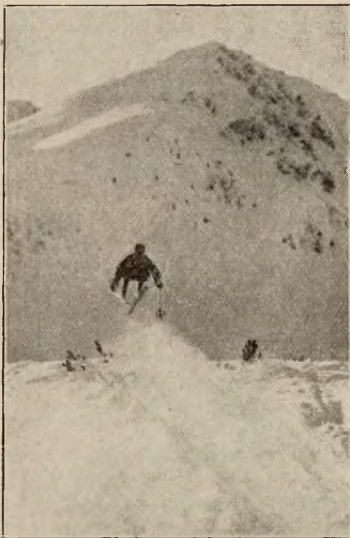
Skok narciarza w terenie.

Zarząd Ogniska po powrocie członków z wyjazdów wakacyjnych zabrał się do wzmożonej pracy. Pierwsze zebranie Zarządu odbyło się w dniu 9 września ub. r. poczem odbyły się jeszcze trzy następne zebrania, z których ostatnie było właściwie zebraniem Komitetu organizacyjnego Akademii Tetmajerowskiej.