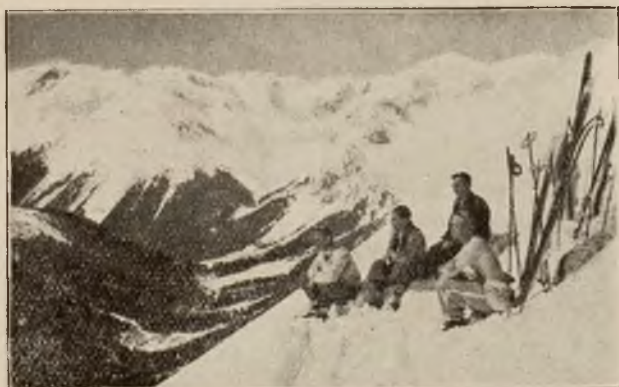
Kąpiel słoneczna na Hali.

Pomimo wszystko narciarstwo w Zakopanem rozwija się żywiołowo i w zimie roi się od narciarzy na wszystkich pobliskich stokach. Posiadamy w Za-