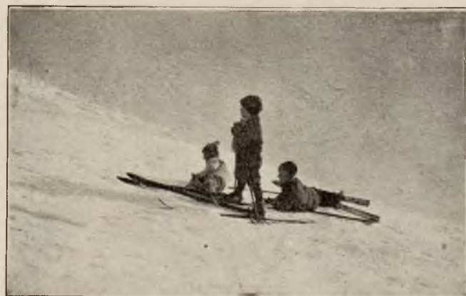
Najmłodsi narciarze w Rabce.

Główną cechą zimy w Rabce jest zupełna cisza powietrza i mała wilgotność. Wiatr nie wieje prawie nigdy, południowy wiatr halny nie dochodzi do Rabki, a od zachodnich i północnych wiatrów jest zdrojowisko dobrze zasłonięte górami. To też w spokojnym powietrzu okiść leży tygodniami na drzewach, tworząc czarowne obrazy, a mróz nawet nie daje się