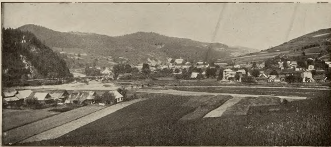
Ogólny widok Muszyny z plażą nad Popradem i ruinami zamku na lewo.