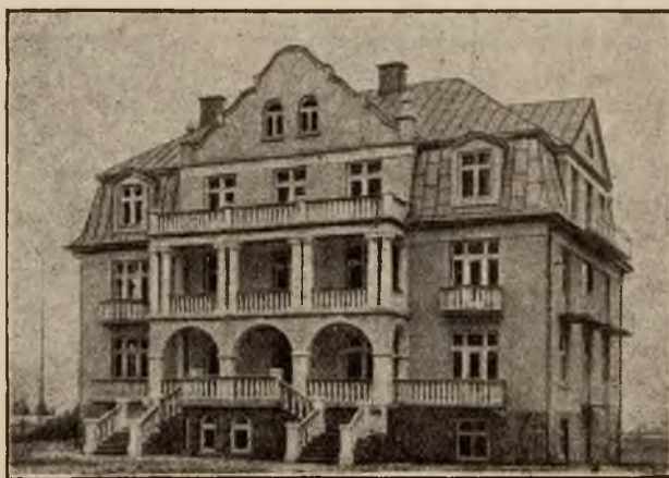
„Jasny Pałac” w Zakopanem.

Pokoje zapełnione są wspaniałymi kompletami mebli, przytem jest tak miło, iż ma się wrażenie przebywania u siebie w domu.