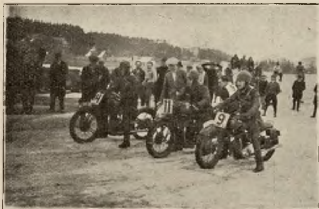
Zawody motocyklowe w Zakopanem. — Start.

Dziś nie możemy sobie wyobrazić Zakopanego bez wielkiego stadjonu, bez toru łyżwiarskiego, bez