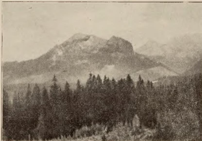
Widok z Bukowiny na Murań i Hawrań.

Jakkolwiek Bukowina pragnie utrzymać charakter wsi podtatrzańskiej z góralskim strojem, gwara