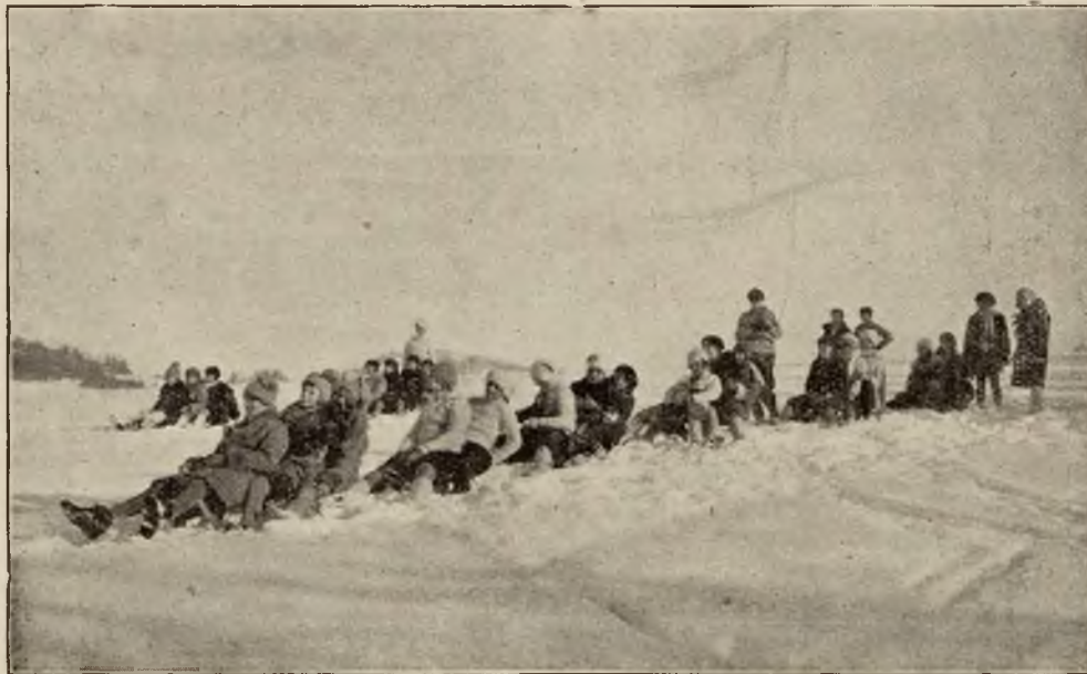
Dzieci na torze saneczkowym w Rabce.

Kuracjusze znajdują dogodne pomieszczenie w przeszło 70 pensjonatach i kulkuset domach mieszkalnych rozrzuconych na znacznej przestrzeni w Rabce, Zarytem, Chabówce, Słonem i Ponicach z mieszkaniami dla kuracjuszków.