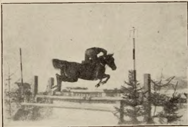
Zawody konne w Zakopanem. — Branie przeszkody.