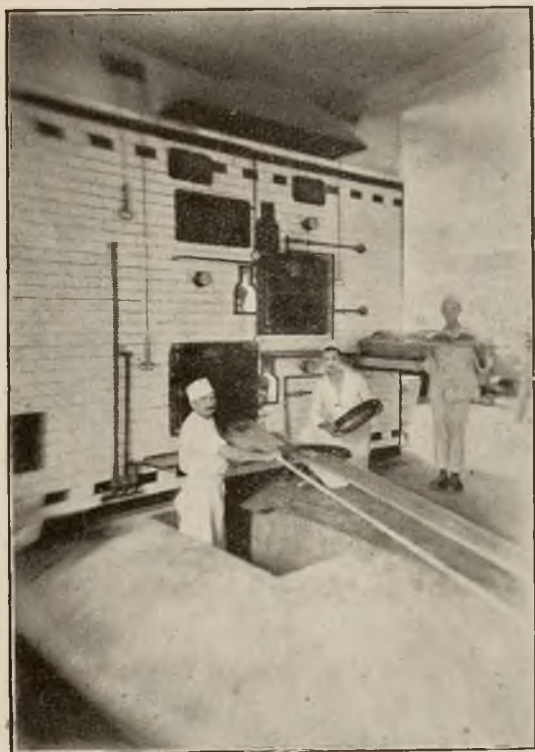
Fragment piekarni. — Piec.