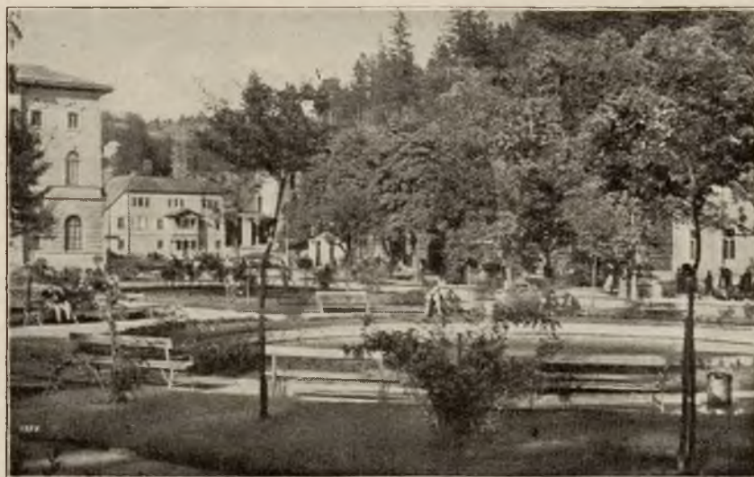
Widok na deptak krynicki.

Zdroje krynickie rozgłosem swym ustaliły Krynicy zaszczytny przydomek „Perły Wód”. Są tu szczawy alkaliczne, wapniowo-żelaziste, bardzo bogate w bezwodnik węglowy i słu-