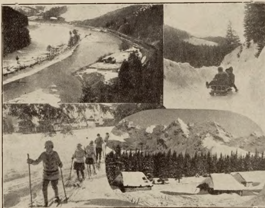
Na lewo u góry: widok na Poprad w Żegiestowie. — Na prawo: kryniczki tor saneczkowy. W dole, na lewo: narciarska wycieczka dzieci w Rabce. — Na prawo: Hala Gąsien. w zimie.