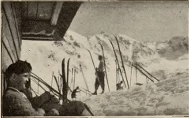
Narciarze przed schroniskiem na Hali Gąs.

Gdy śnieg otuli swym jasnym puchem rozległe równiny i bezkresne pola, gdy otuli szare zagajniki i nadrzeczne łąki... idzie smutek przez cały kraj i wydaje się, jakby uleciała radość gdzieś w dal... i jeno