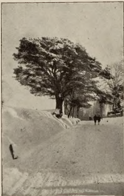
Oryginalna sosna przy głównej arterji w Rabce-Zdroju.

Urządzenie to doprowadzające naturalną solankę do domów jest naogół mało znane, a jest to przecież niezwykle udogodnieniem, że i w zimie można przeprowadzić kompletną kurację rabezańską.