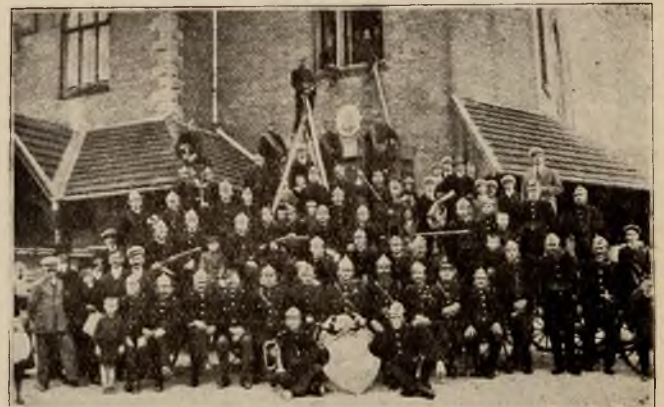
Straż ogniowa w Jordanowie.