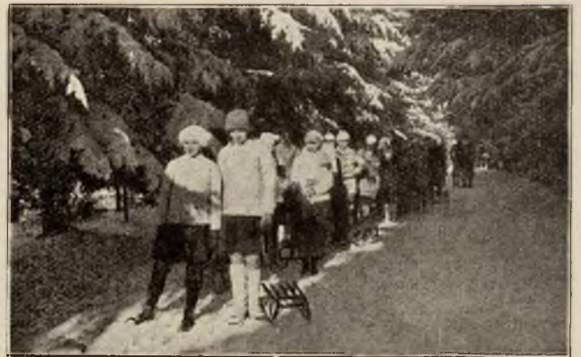
Wycieczka na tor saneczkowy w Rabce.

Wszystkie te inwestycje mają niewątpliwie bar-