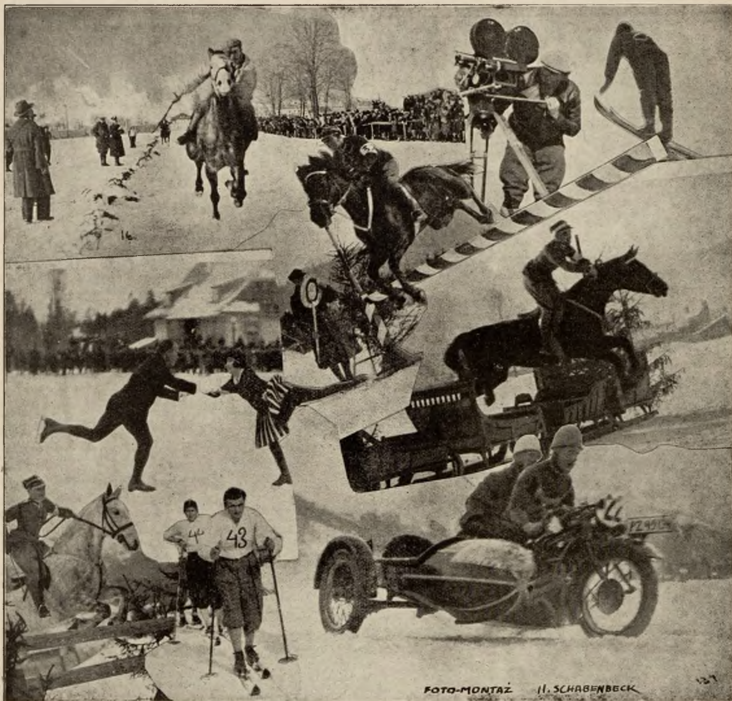
Najciekawsze momenty ze stadionów sportowych w Zakopanem.