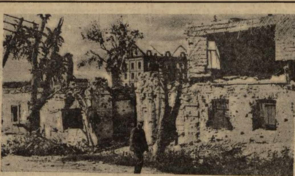
Tak wygląda Białogrod. Każda ulica, każdy dom i każde drzewo noszą ślady wielkiej bitwy.