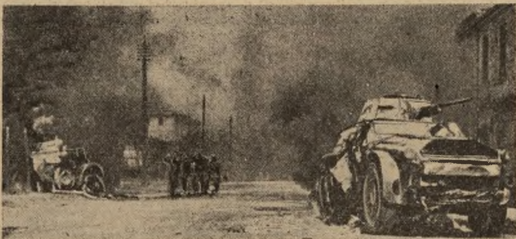
Po krótkich walkach ulicznych niemieckie wojska obsadziły Rzym.

wątpić, że jeżeli Rommel wszystko rzuci na szalę, wojska Eisenhowera zostaną zmuszone do defensywy.