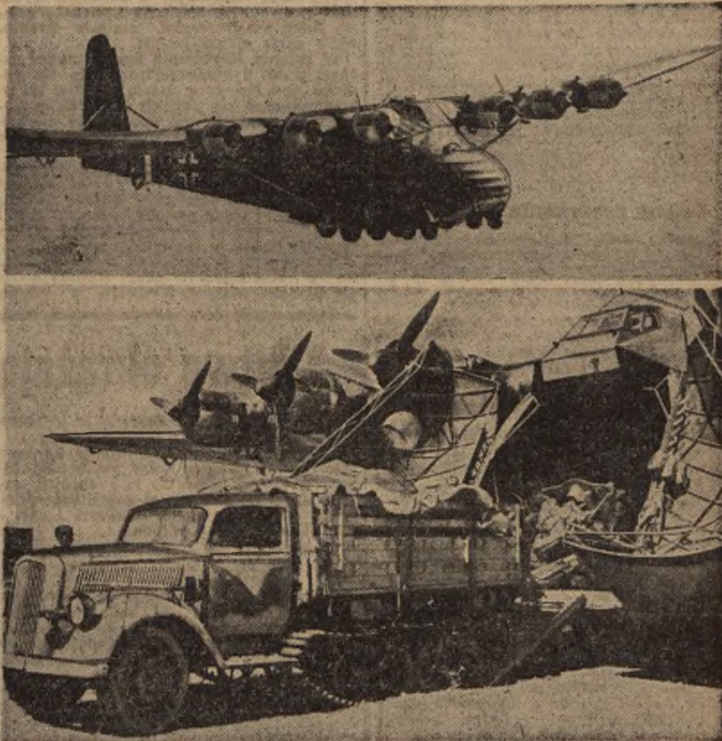
Powyżej: Ostatnio przez niemieckie zakłady zbrojeniowe wyprodukowany samolot dalekodystansowy MS 323 „Gigant” posiada 6 motorów. Od pewnego czasu nowy ten typ samolotu używany jest na froncie, gdzie wykazał swoje walory. Poniżej: Oto samochód, który obładowany różnym sprzętem wojennym i ciągnąc za sobą działo — opuszcza wnętrze nowego samolotu transportowego „Gigant” po odbyciu w nim dalekiej drogi.

Już choćby ten fakt pozwala zorientować się, jak podkreśla dziennik, że rezerwuariusz ludzki bolszewizmu tonie nie wskutek niesłychanych strat w bitwach, do których Stalin bez przerwy rzuca swoje armie. Dziennik podkreśla fakt, że bolszewicy na obszarach zajętych przez siebie ponownie terenach zaciągają do wojska wszystkich cywilnych mężczyzn w wieku od 15 do 60 lat i w związku z tem zauważa: rejestrujemy te fakty, jako uboczne zjawiska zmagania na Wschodzie, mogą one bowiem służyć jako podstawa do naczynego dowodu, iż teza o decydującym znaczeniu przewagi mas ludzkich i materialowych na dłuższy okres czasu nie da się utrzymać. Z drugiej strony nie może ulegać żadnej wątpliwości, że chodzi tu narazie wprawdzie tylko o charakterystyczne zjawiska, przyczem naogół biorąc wojska niemieckie mają wciąż jeszcze do czynienia z silnym i bezwzględnie kierowanym przeciwnikiem. Ale także i tutaj, jak stwierdza w zakończeniu dziennik, czas pracuje dla Niemiec. Podczas gdy bolszewicy wskutek licznych okoliczności są zmuszeni zmierzać do jakiegoś wyniku, mobilizując