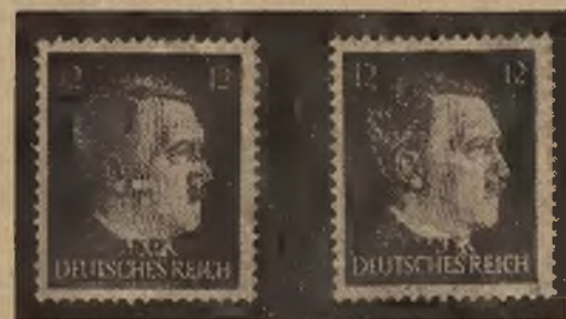
Nowe znaczki Ostlandu i Ukrainy wykonane drukiem cziolkowym.

Co to jest limit? Ów, tak trudny do przewidzenia limit, za który można osiągnąć poszukiwany znaczek jest granicą, do której nabywca korespondencyjnie pragnie licytować. Limit należy ustalić zgodnie ze skalą zwykłych stawek, podaną w katalogu, t. zn. w cyfrach okrągłych, a nie np. 1.079.47 zł., gdyż powyżej 1000 złotych można podbijać cenę tylko po 50 zł. Celem uniknięcia pomyłek pożądanym jest przy zamówieniach korespondencyjnych zaznaczenie kraju znaczka i numeru, czy nawet ceny katalogu Michla. Limit postawiony przez nabywcę prowincjonalnego, powinien być tajemnicą. Dlatego też, chociaż jeszcze nie ustalono tego ostatecznie, przewiduje się nadsyłanie zamówień osobno dla każdego losu w zamkniętej kopercie, noszącej jedynie Nr. aukcji, losu, oraz nazwisko zamawiającego. Osoba upoważniona przez aukcjonarjusza otwiera zamknięte koperty tuż przed rozpoczęciem licytacji, celem stwierdzenia, czy wada zostały nadesłane w należytej wysokości w stosunku do zamówień. Następnie jeśli np. na los wywołany przy 12 złotych nadesłano 3 zamówienia na 18 zł., 35 zł. i 45 zł., odpadają automatycznie dwa niższe zamówienia, a rzecznik działający w imieniu najwyższego limitu zaczyna licytować od 40 zł., to znaczy pierwsze stawki wyższej, niż konkurenta. O ile nie znajdzie się nikt na sań, toby dał 45 zł., wówczas amator z prowincji otrzymuje znaczek poniżej zaofiarowanej ceny.