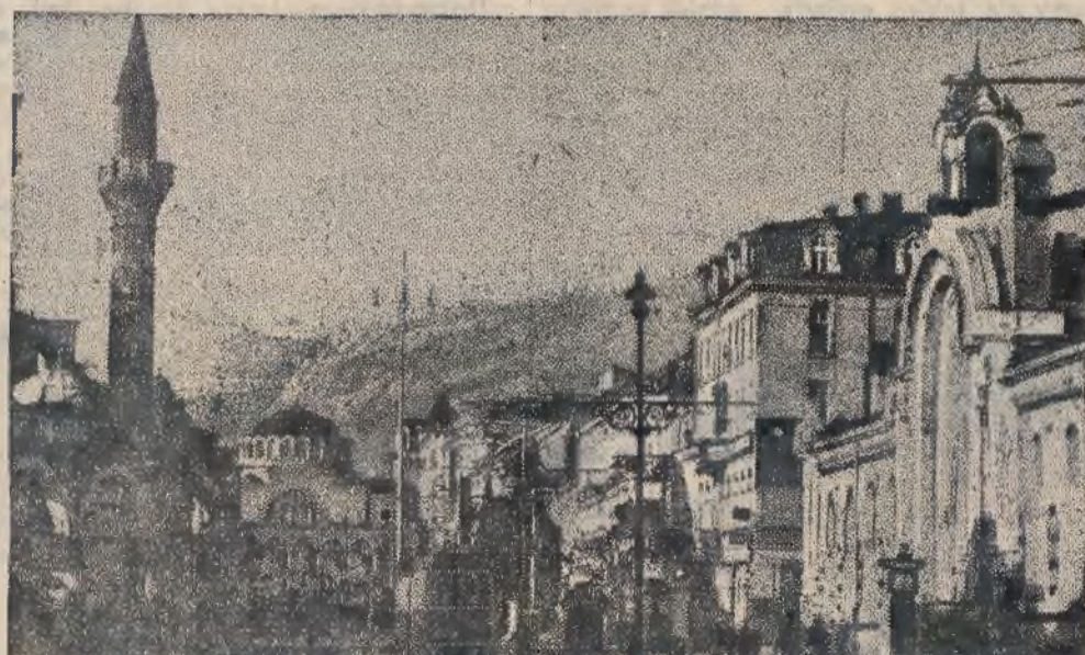
Fragment Sofji z meczetem mahometańskim na pierwszym planie.