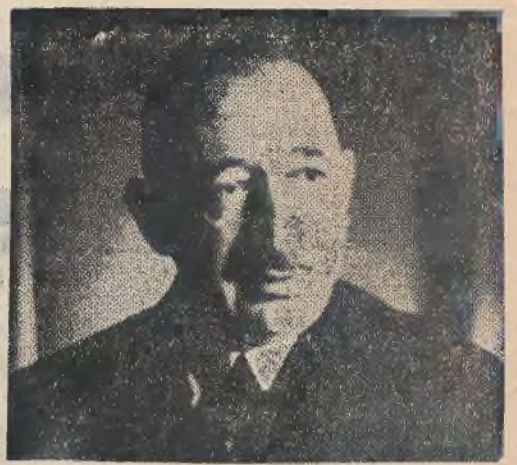
Premier bułgarski dr Filoff.

Szczupłe wiadomości nadeszłe stamtąd dotychczas pozwalają wnioskować, że w całej Bułgarii tak ten nowy fakt został zrozumiany. We wszystkich miastach i miasteczkach wywieszono liczne flagi, zaś szczególnie uroczyste przyzdobiona jest stolica Bułgarii Sofja.