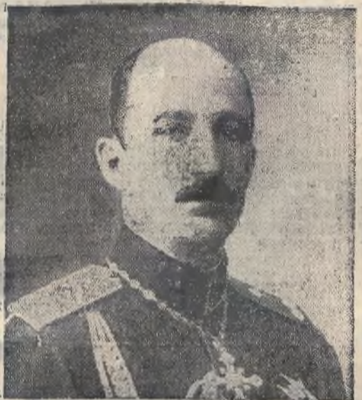
Król Bułgarii Borys.