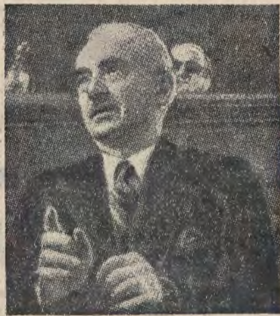
İnönü İsmet, prezydent Turcji.

turecki minister spraw zagranicznych Szukri Saracoglu.