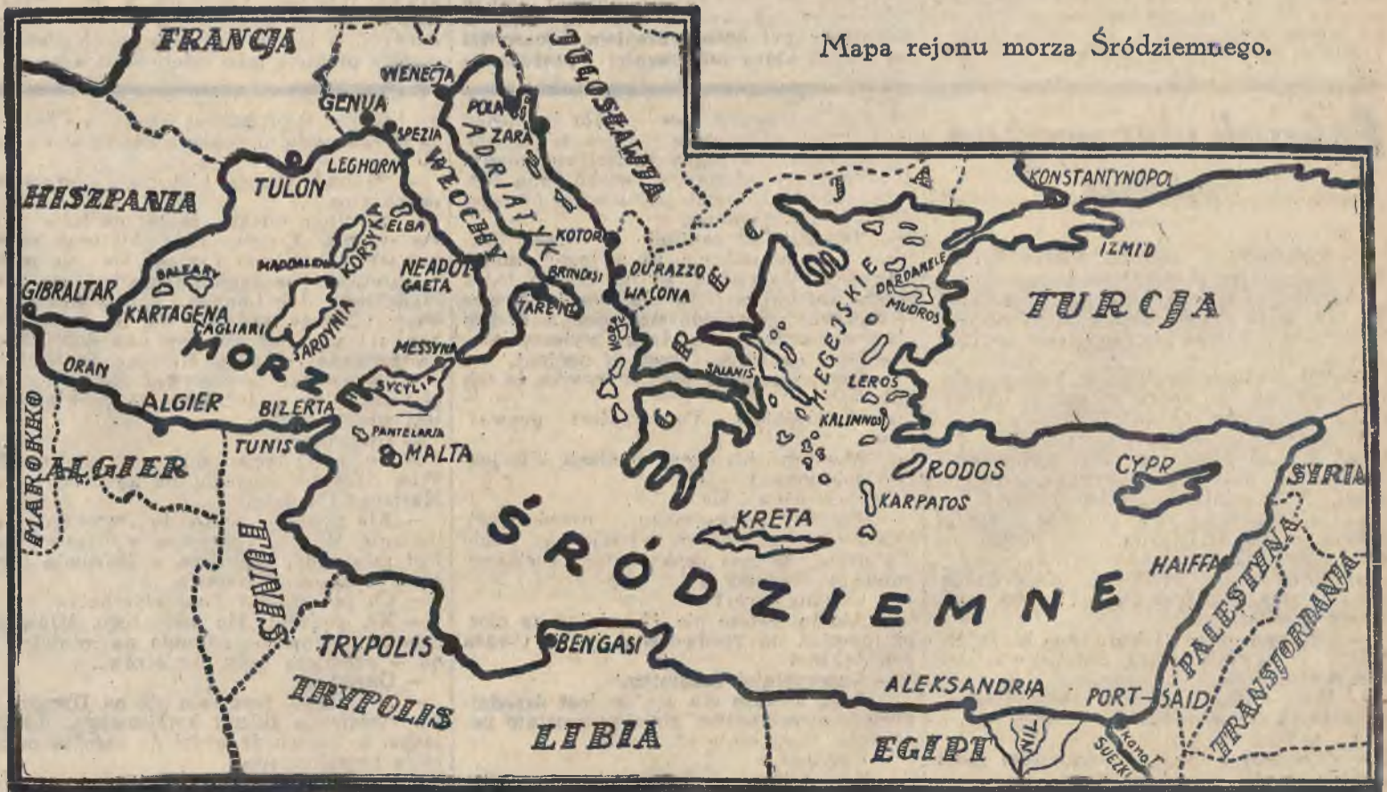
Mapa rejonu morza Śródziemnego.

We wschodniej części morza Śródziemnego jedna z włoskich łodzi podwodnych za-