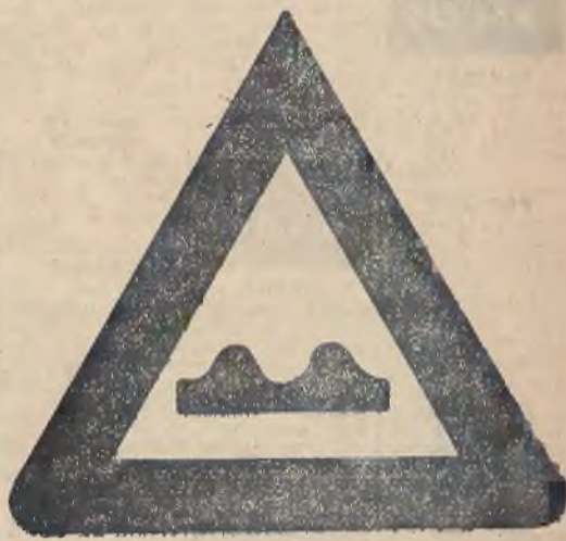
Rysunek rowu, wykonany w czarnym kolorze, zamknięty czerwonym trójkątem, oznacza, iż należy uważać na poprzeczny ściek na szosie.

(Ja) ZAMACH SAMOBÓJCZY WIEŹNIA. Pozostający w areszcie Franciszek Rymara lat 31, usiłował popełnić samobójstwo przez poćięcie sobie głowy żyłką. Po opatrzeniu przez lekarza Pogotowia Rat. powożonego go w areszcie.