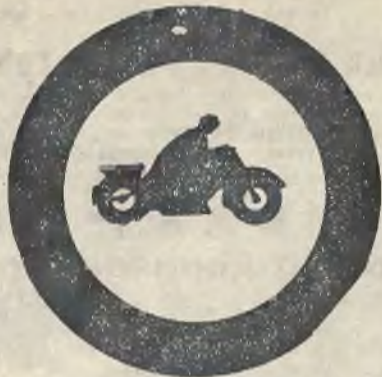
Czarna sylwetka motocyklisty, otoczona czerwonym kołem, oznacza, że dana droga jest zamknięta dla motocykli.