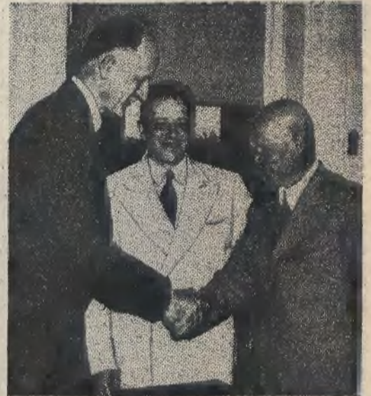
Zdjęcie nasze przedstawia moment powitania bolszewickiej misji, która przed niedawnym czasem przybyła do Waszyngtonu z prośbą o pomoc, przez sekretarza stanu w radzie Stanów Zjednoczonych Sumnera Wellesa (na lewo).

szlaku handlowego, to trzeba by pomyśleć przede wszystkim o kanale Panamskim. Jeżeli Turcji odmawia się prawa do Istanbulu, który od przeszło 500 lat jest w posiadaniu tureckim, to uprawnienia Stanów Zjednoczonych do kanalu Panamskiego są niezaprzeczalne.