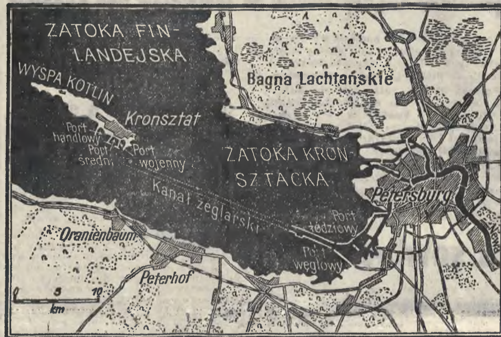
Mapka Petersburga i terenów sąsiednich.