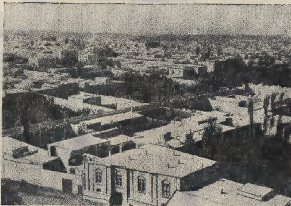
Pod wpływem niedawnych wydarzeń w Iranie szerokie koła społeczeństwa zapoznają się z miastem Taebriś, drugim co do wielkości po Teheranie, miastem Iranu. Zdjęcie nasze przedstawia widok ogólny miasta Taebriś.