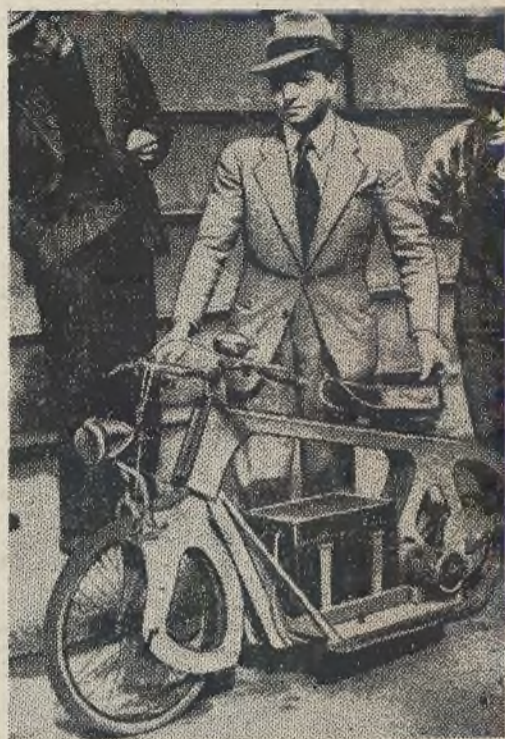
Pewien inżynier paryski skonstruował motocykl, pędzony elektrycznością, ważący zaledwie 65 kg. Przy zasięgu 100 km. szybkość motocykla wynosi 30 km. na godzinę. Siły napędowej dostarczają motocyklowi baterie o napięciu 12 Volt. Zdjęcie nasze przedstawia nowy typ motocykla wraz z jego konstruktorem.