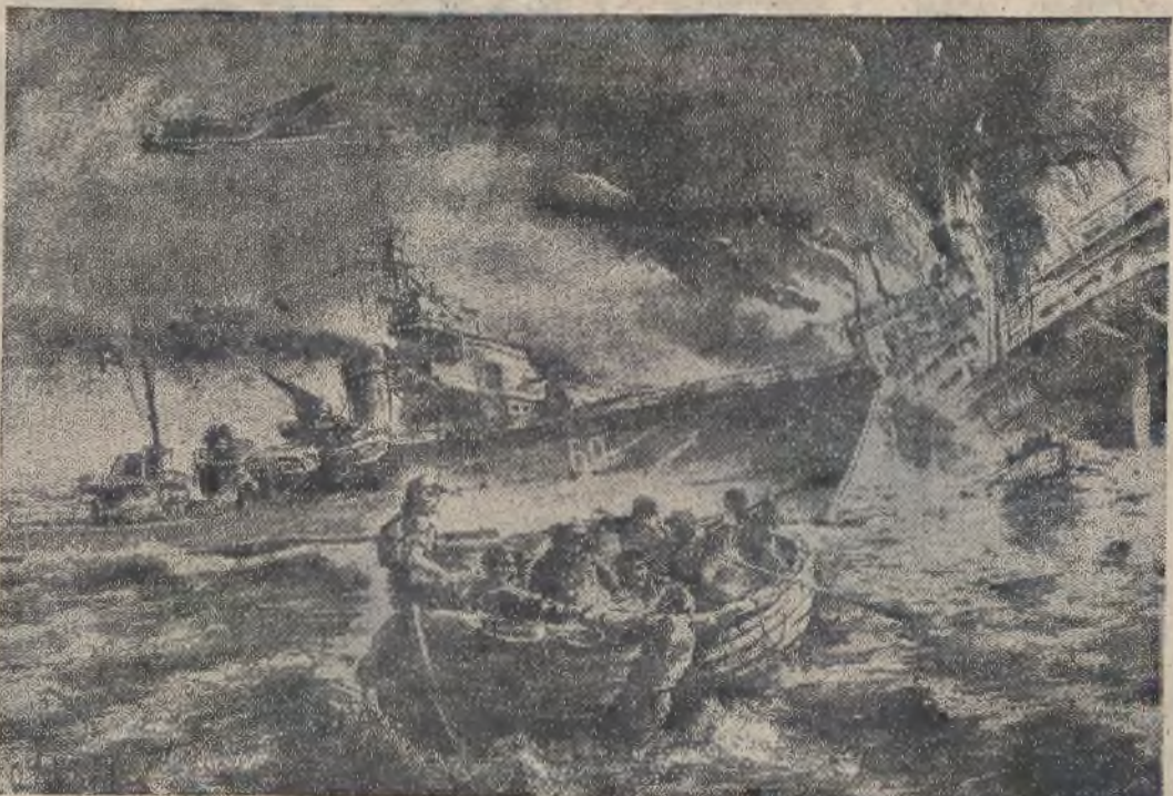
Samoloty niemieckie atakują wojenne i handlowe statki w zatoce fińskiej, zatapiając i unieszkodliwiając liczne jednostki marynarki sowieckiej. Jeden z rysowników niemieckich ukrył się z całym reżimem atak samolotów niemieckich na komwoj so-wietów, który to obrazek widoczny na powyższym zdjęciu.