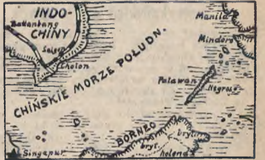
Mapka sytuacyjna wyspy Borneo.

Sztokholm, 19 grudnia. Jak donosi korespondent londyński „Nya Dagbligt Allehanda”, w ciągu ostatniej nocy zaszło szereg niewesołych dla Anglii wypadków w Azji wschodniej. Fakt wylądowania Japończyków w Sarawak na Borneo, wskazuje wyraźnie na to, iż siły morskie i lotnicze Anglików i ich sprzymierzeńców zaabsorbowane są do najwyższego stopnia.