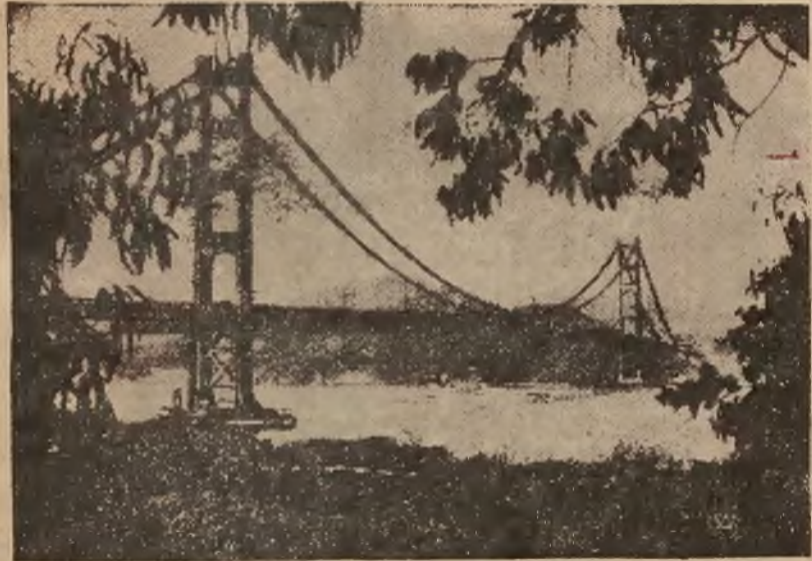
Jednym z największych i najwspanialszych mostów świata na naszym zdjęciu most, zawieszony nad kanałem Złotej Zatok, obok San Francisco, zwany mostem

wspanialszych mostów świata na naszym zdjęciu most, zawieszony nad kanałem Złotej Zatok, obok San Francisco, zwany mostem