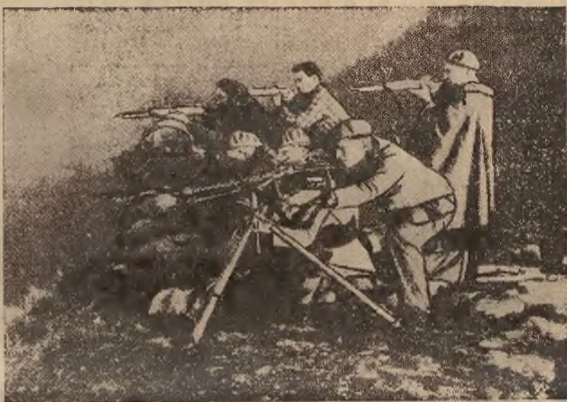
Reprodukujemy zdjęcie, przedstawiające pozycję wojsk powstańczych generała Franco pod Madrytem.

SKŁADAJCIE OFIARY NA Fundusz Obrony Morskiej