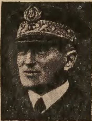
Viceadmirał Dailan został mianowany szefem floty francuskiej.

W finałowym spotkaniu turnieju mistrz Turcji Fener Bagdche pokonał drużynę Ankaragucu w stosunku 1:0.