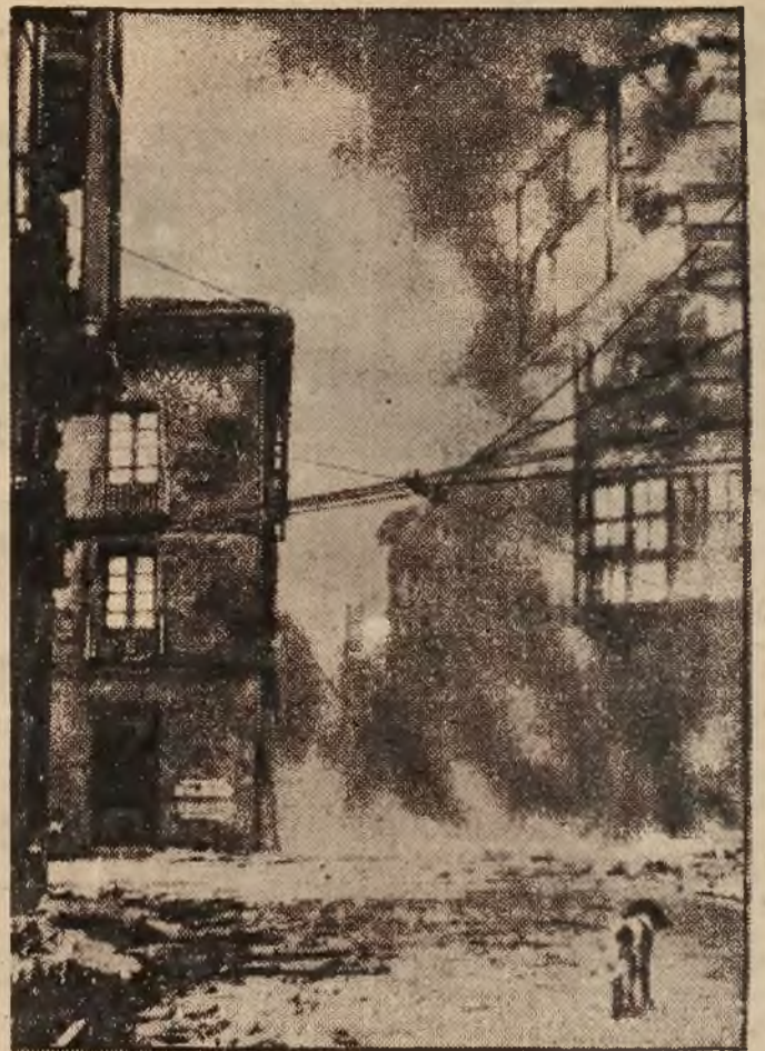
Gruzy i zgłiszcza miasta Guernica w prowincji Basków, jako rezultat krwawych i morderczych walk.

Jak widać oskarżeni starają się cały wypadek doprowadzić do sprawy osobistej. Prawdopodobnie im to się nie uda i nie unikną surowej kary.