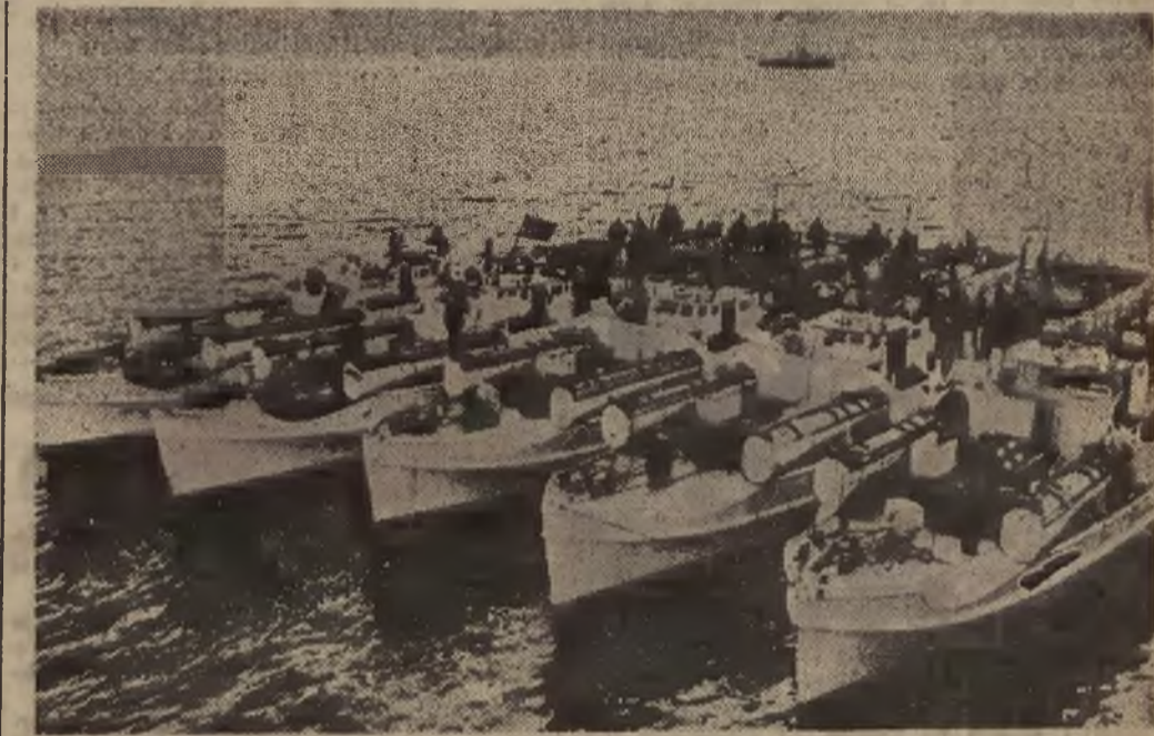
Do nowej broni, jaka powstała w czasie obecnej wojny, należy ścigacz. Niemiecka marynarka wojenna dysponuje silnymi zespołami ścigaczy, które bez przerwy są w akcji.

Dla Związku Sowiewskiego — jak ciągnie dalej czasopismo — „sprawa ta jest już załatwiona i zlikwidowana. Jest to fakt zakończony tak dokładnie, jak grób z ustawionym na nim drewnianym krzyżem. Według poglądu sowiewskiego Polska jest pogrzebana. Jeżeliby się wobec tego chciało zmusić Związek Sowiewski do dotrzymania dawniejszych układów i poszanowania in-