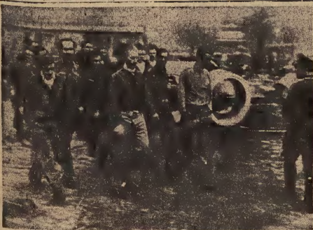
Zestrzeleni północno-amerykańscy lotnicy terrorystyczni maszerują do obozu jeńców.

W międzyczasie rozpatrano wszystkie środki agitacyjne, celem zmobilizowania opinii publicznej, przedewszystkiem sił zbrojnych, przeciwko kongresowi.