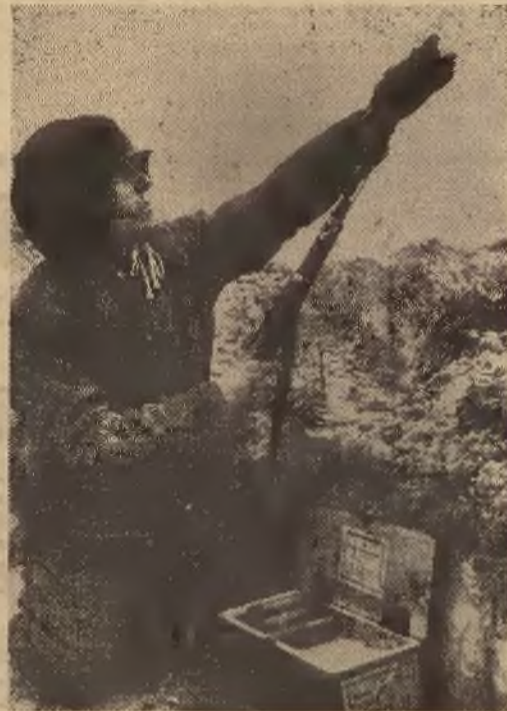
Niemiecki granatnik na froncie wschodnim. Specjalne urządzenia umożliwiają wyrzucanie granatów ze zwykłego karabinu.

Na północnym odcinku frontu wschodniego sytuacja pozostała bez zmian na północ od Nowy, mimo, że bolszewicy rzucili do boju powyżej 12 dywizyj piechoty, po-