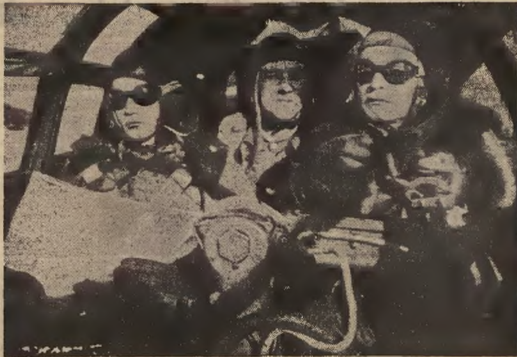
Niemiecy lotnicy podczas lotu na nieprzyjaciela.

Pomimo kilkakrotnych tych przestróg ze strony rozgłoszonia watykańskiej, anglo-amerykańskie lotnictwo terrorystyczne w dalszym ciągu wykonywało owe ataki bombowe.