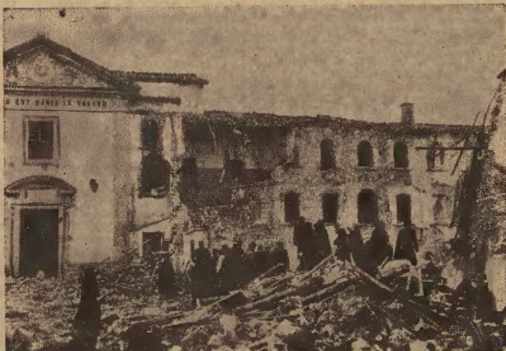
Fragment zniszczonych budynków w Castell Gandolfo — letniej siedzibie papieża.

Sztokholm, 11 marca. Kanadyjski prezydent ministrów Mackenzie King oświadczył według brytyjskiej służby informacyjnej, na wczorajszym posiedzeniu Izby niższej, iż kanadyjscy dyplomaci w Buenos Aires otrzymali wskazówkę wstrzymania się od wszelkiego oficjalnego kontaktu z rządem Farrela, aż do czasu wyjaśnienia niezmiernie zawiślanej i nieprzejrzystej sytuacji w Argentynie. To polecenie odpowiada, jak Mackenzie King oświadcza, zażętemu przez brytyjski i północno-amerykański rząd stanowisku wobec Argentyny.