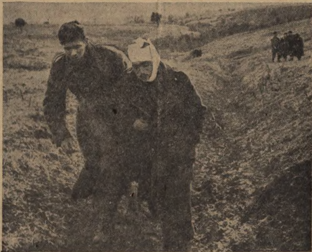
Z frontu południowego: Anglo-Amerykanie, na drodze do miejsca opatrunkowego pewnej niemieckiej jednostki wojennej.

łej Europy. Udowadnia on, że wojnę światową prowadzi się obecnie wyłącznie tylko jeszcze z punktu widzenia imperjalizmu młota i sierpa. M. in. mówi on: „My Hiszpanie wiemy o tem dobrze, że polityka sowiecka zdążyła od 25 lat niezmiennie do jednego celu, a mianowicie do rewolucji światowej. Dla Moskwy nie istnieją żadne granice, żadne umowy i żadne pakt, któreby posiadały jakieś widoki na respektowanie. Świat może zagłębiać się w dyskusji nad tem, czy wykonana będzie lub nie inwazja anglo-saska do Europy, mogą się odbywać najróżniejsze konferencje polityczne — bolszewicy przypatrują się temu spokojnie, a w danym momencie potrafią oni zrealizować z Moskwy swe żądania nawet wbrew woli planowanych sojuszników”.