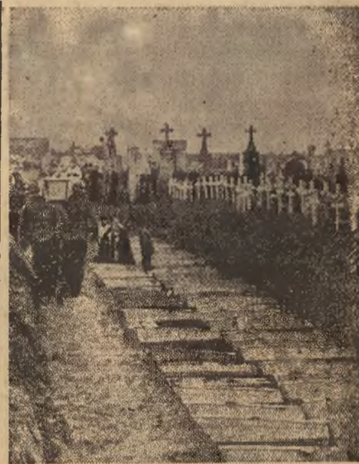
Skutki nalołów terrorystycznych: Oto fragment cmentarza, na którym spoczęły ofiary nalołów terrorystycznych, pochodzące z pewnego belgijskiego miasteczka.