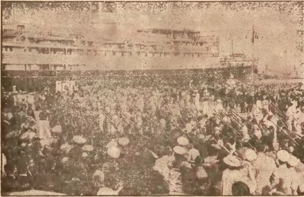
Studencki bataljon „czarnych koszul“ powraca z wojny Abisyńskiej. W Neapolu przyjął go uroczyste następcą tronu ks. Umberto.