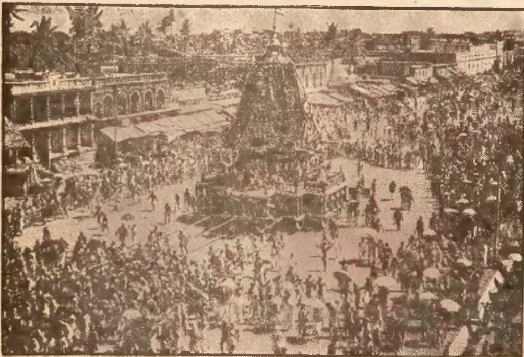
Największym świętem religijnym Indyj jest wielka procesja dekorowanych wagonów.