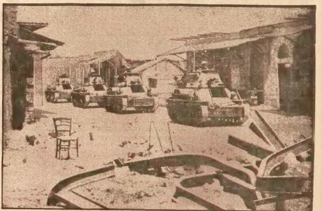
Tanki angielskie zajęły centrum terrorystycznych grup arabskich, miasto Lydda.