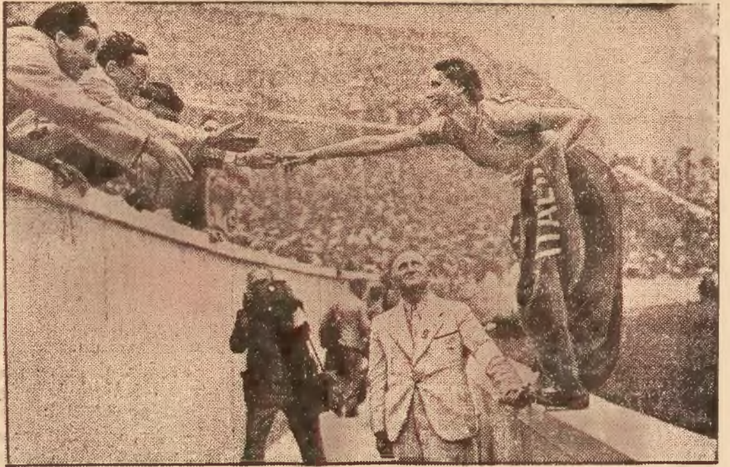
Znakomita płotkarka włoska, Valla, po zwycięstwie przyjmuje gratulacje od szczęśliwych rodaków, zresztą licznie zebranych na stadionie berlińskim.