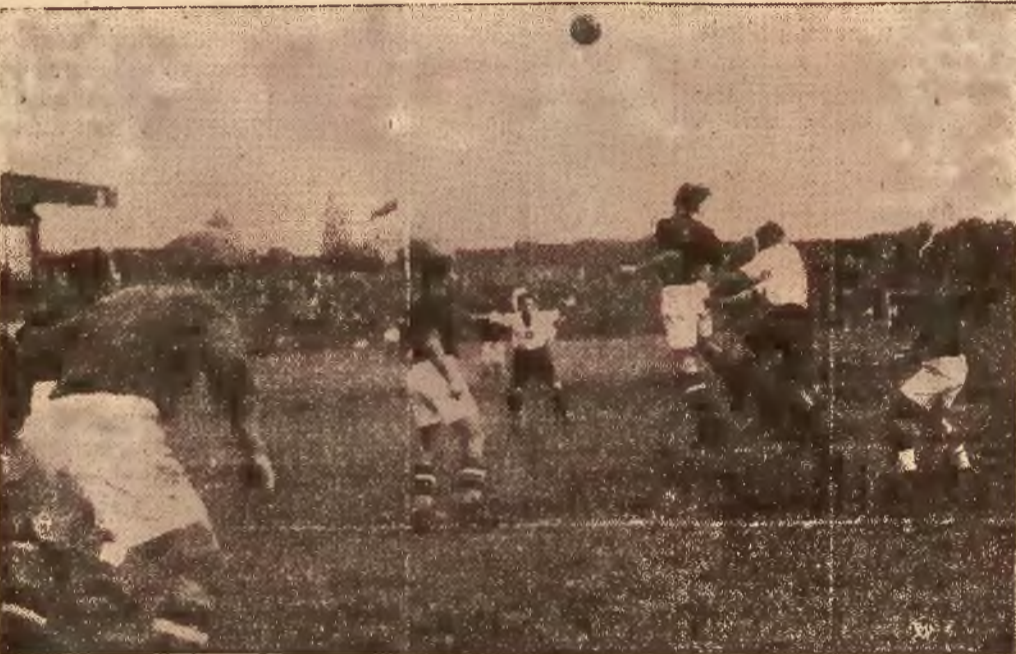
Moment z meczu piłkarskiego Polska — Węgry 3:0. Akcja toczy się pod bramką węgierską. Bramkarz węgierski, Regi, jest zaniepokojony.