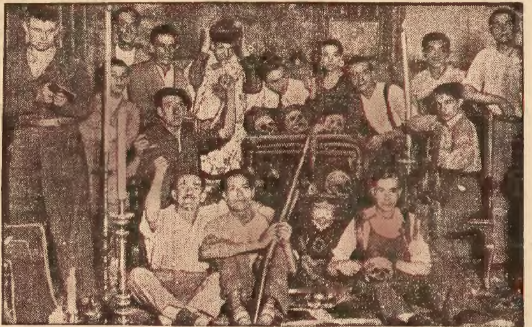
Rzecz dzieje się w kościele. Zebrała się tu grupa osób z zamiarem zamieszkania. Niesamowite wrażenie wywierają rozrzucone trupy czaszki.