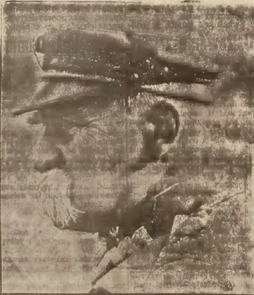
PIERWSZY MARSZAŁEK POLSKI JÓZEF PIŁSUDSKI

Uroczystości dzisiejsze rozpoczną w stolicy nabożeństwo w kościele Matki Boskiej przy ul. Łazienkowskiej oraz w kościele św. Florjana. O godz. 10-ej w Filharmonii odbędzie się Akademia Zw. Inwalidów Wojennych, o 11-ej nastąpi odsłonięcie tab-