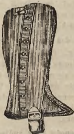
Rymarsko-siodlarski Orząd Zakład