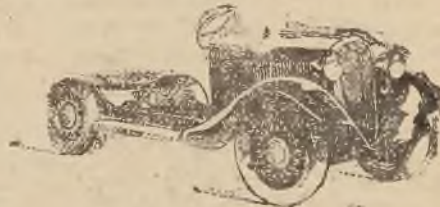
P O L S K I F I A T 500

Cena zł. 3.500.— Rozstaw osi 2300 mm Hamulce hydrauliczne Udźwig na ramie 650 kg