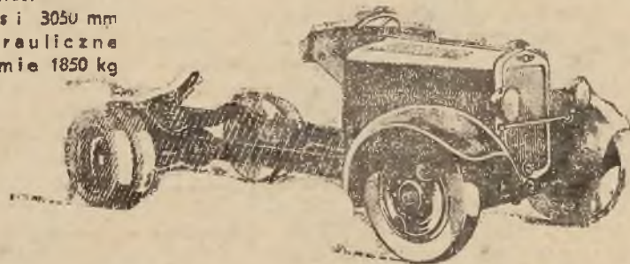
P O L S K I F I A T 618

Cena zł. 7.100.— Rozstaw osi 3050 mm Hamulce hydrauliczne Udźwig na ramie 1850 kg