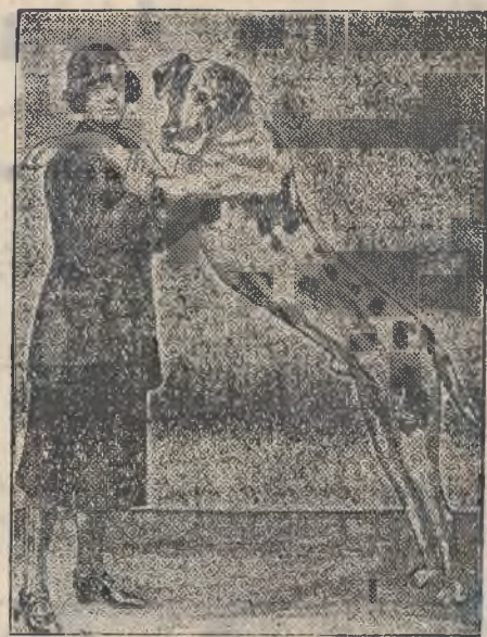
WSPANIAŁY OKAZ DOGA DUŃSKIEGO.