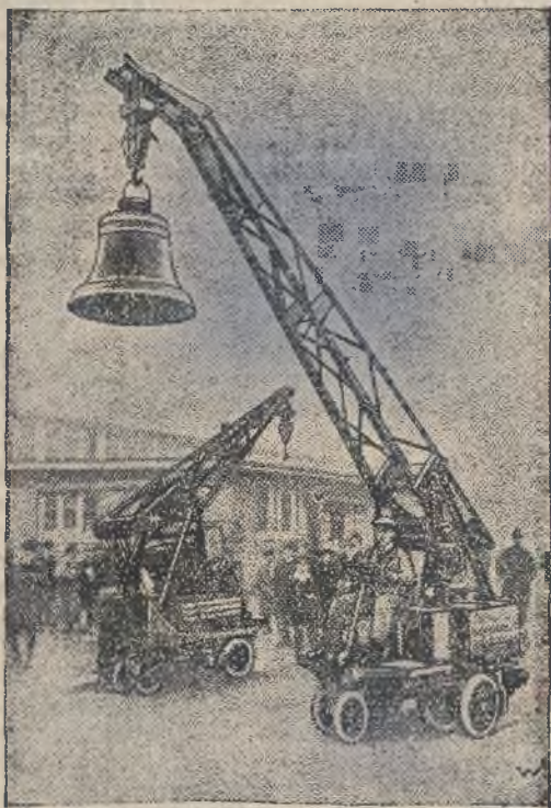
TARGI WIOSENNE W LIPSKU

Na posiedzeniu tem ukończono szczegółową dyskusję nad referatem dr. Weinfeldta w sprawie programu akcji oszczędnościowej w Ministerstwie Wyznań Religijnych i Oświecenia Publicznego, rozpoczęta na posiedzeniu, odbytem w dniu 17 z. m.