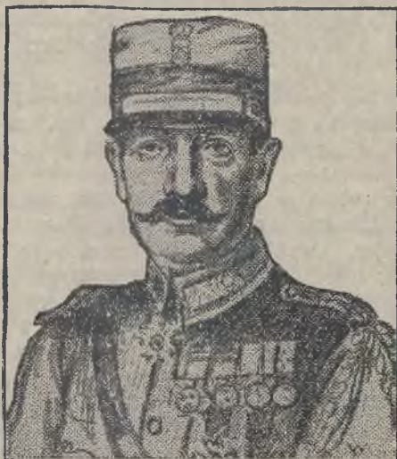
GENERAL PANGALOS WYPOWIADA WOJNE zwolennikom parlamentaryzmu, wysuwając własną kandydaturę na prezydenta w Grecji.

W przeprowadzaniu badań okazało się, że po stronie rosyjskiej w Mińsku drukowane i wysyłane są do Polski podburzające odezwy w celu wywołania niepokojów i antypaństwowych rozruchów w dniu socjalistyczno-komunistycznego „święta“ 1 Maja. Przytem ujawniono, że bolszewicy na kresach wschodnich tak samo jak Niemcy na Śląsku, spekulują na niezadowoleniu bezrobotnych. Znajdujemy się więc pomiędzy młotem i kowadłem, bo z jednej strony Rosja, z drugiej Niemcy chcą u nas wywołać zamęt, podburzyć dla swych potwornych celów właśnie tych, którzy im swe obecnie trudne położenie mają do zawdzięczenia.