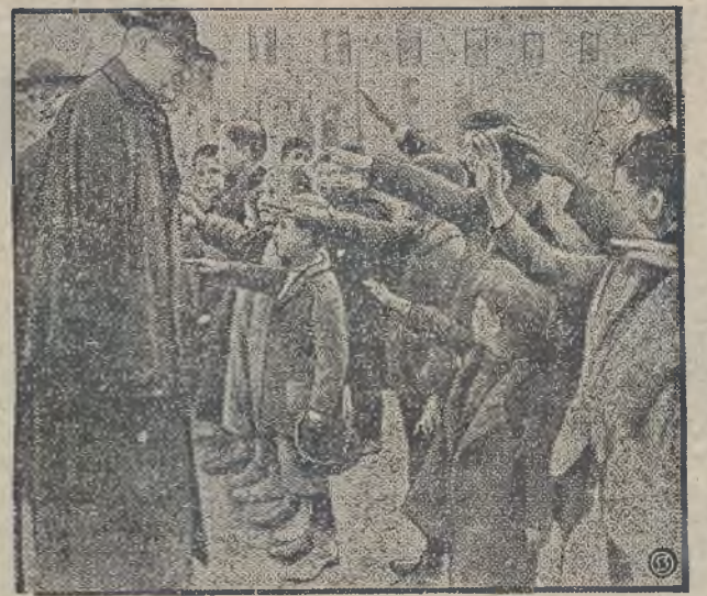
MUSSOLINI WPROWADZA NOWE PORZADKI W SZKOŁACH.

Wówczas prezydent Coolidge na mocy prawa łaski darował mu tę karę, wobec czego nie już nie stało na przeszkodzie wykonaniu egzekucji.