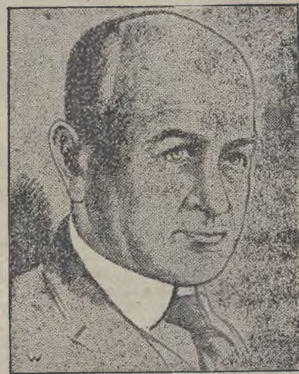
NOWY GUBERNATOR GEN. W INDJACH HOLENDERSKICH.

Na trzecim posiedzeniu wzrosła ilość delegatów do 502 osób, pochodzących z 26 państw, w którym mieszkają emigranci rosyjscy.