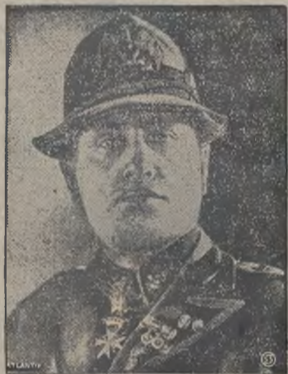
ZAMACH NA MUSSOLINIEGO

Pomiędzy zbuntowanym oddziałem wojska aresztowano 18 oficerów, których odesłano do Aten, gdzie staną przed sądem wojennym. W Salonikach panuje spokój. Większa część armji i marynarki stoi wiernie po stronie gen. Pangalosa.