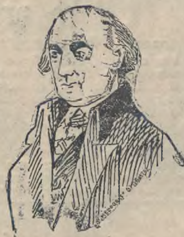
STANISŁAW MAŁACHOWSKI, marszałek Sejmu Czteroletniego, na którym uchwalono Konstytucję.

cę w wykonywaniu zarządzeń, podjętych w obronie i dla zachowania praw i wolności mieszkańców tych wysp. Prawa, zdobyte przez kraj, są podstawą bytu jego obywateli. Prawa te dźwierzycie w swoich rękach, a strażnikami ich uczyniliście Parlament Brytyjski. Strajk powszechny, który wzniecono, jest wyzwaniem, rzuconem strażnikowi waszych praw i prowadzi na drogę anarchii i ruiny kraju.