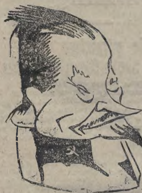
GENERAL HALLER W KARYKATURZE.