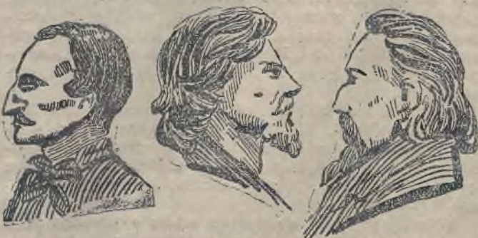
NAJWIEKSI MALARZE POLSCY:

Jan Matejko. — Henryk Siemiradzki i Artur Grottger.