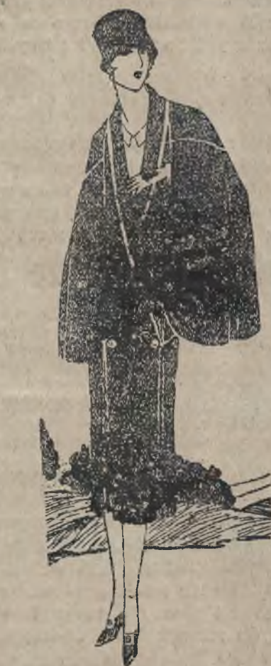
Płaszcz z ciemno-niebieskiego materiału wełnianego ozdobiony srebrnymi taśmami.