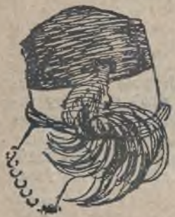
b) Najmodniejszy kapelusz słomkowy przystrojony krosami