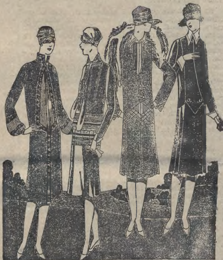
Najnowsze modele gustownych sukienek spacerowych.