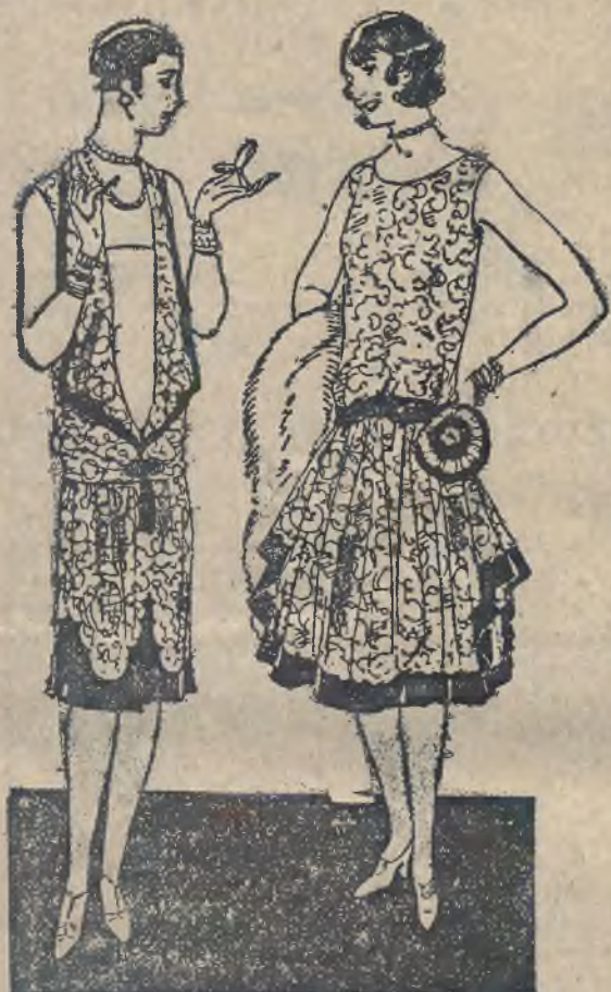
Dwie wykwintne toalety wieczorowe bogato koronkami ozdobione.