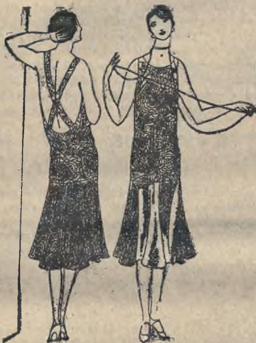
Nadzwyczaj efektowne sukienki wieczorowe z zielonego atlasu haftowane srebrem, skombinowane z spódniczką z srebrnej lamy.