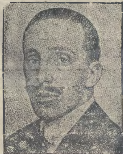
KRÓL HISZPAŃSKI ALFONS.

Między nim a dyktatorem Hiszpanji Primo de Rivera powstał zatarg, który może zachwiać stanowisko dyktatora.