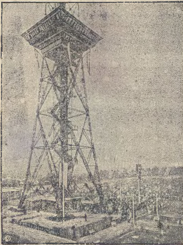
NOWA STACJA NADAWCZA.

W Sztokholmie zbudowana została najbardziej imponująca na świecie radiowa stacja nadawcza.